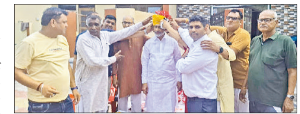
भिवानी। नवनि्युक्त उपप्रधान को पगड़ी बांधकर सम्मानित करते हुए।