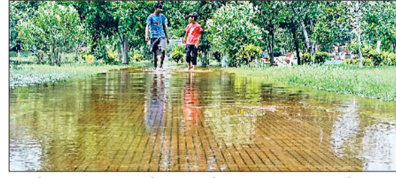
भिवानी। नेहरू पार्क में पगंडी पर जमा सीवरेज व बरसात के गंदे पानी में से निकलते बचे व पार्क में जमा सीवरेज व बरसाती पानी में डूबे बैठने के बँच।