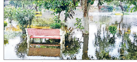
भिवानी। जमा सीवरेज व बरसाती पानी में डूबे डस्टबिन व पेड़-पौधे।