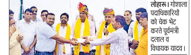
लोहारू। गोशाला पदाधिकारियों को चेक भेंट करते पूर्वमंत्री दलाल व विधायक यादव।